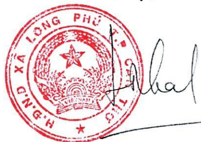
Lâm Tiến Thạch